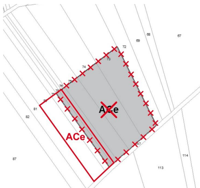
Evolution dans le cadre de la modification simplifiée n°2

Le tableau des superficies relatif aux zones agricoles figurant page 255/354 du rapport de présentation est modifié en conséquence de la manière suivante :