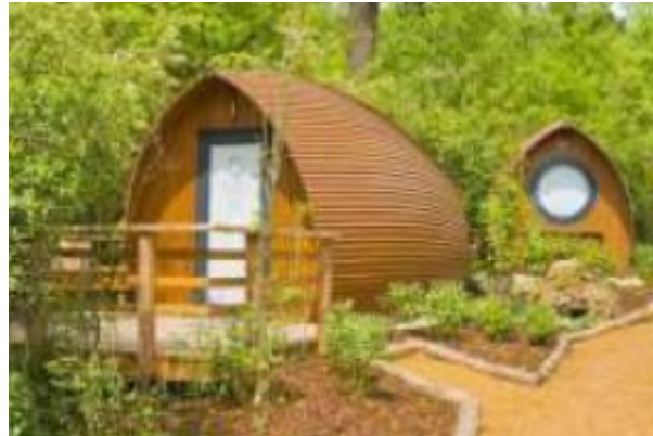
Exemple d'un bungalow existant (Glamping resort – Biosphère Bliesgau)