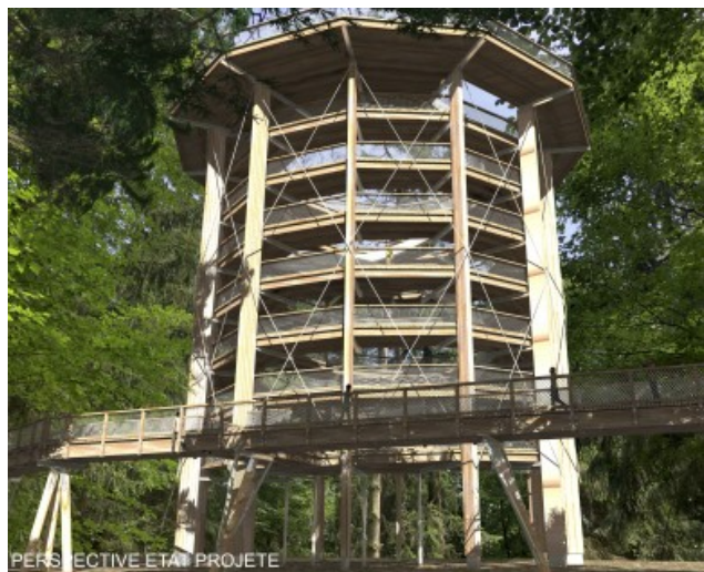
PERSPECTIVE ETAT PROJETE Extrait du dossier de permis de construire – projet de tour