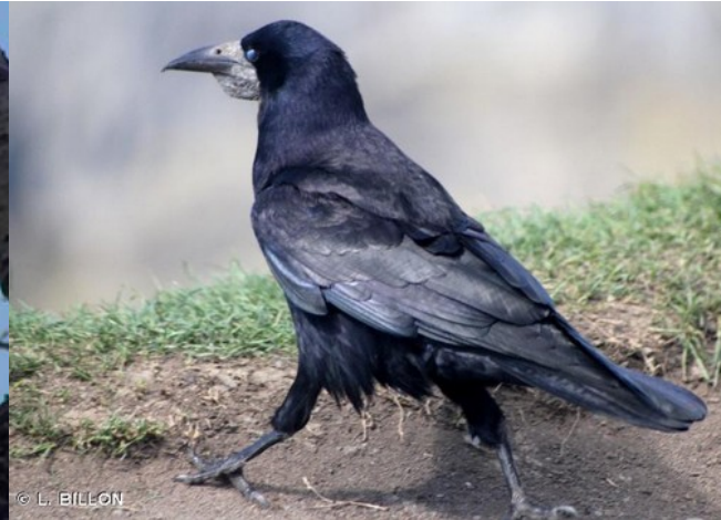
Choucas des tours

Il est envisagé d'adapter le calendrier de la phase défrichement aux périodes sensibles pour l'avifaune et les chiroptères. Ainsi, les travaux seront réalisés entre début septembre et fin février. Selon l'Ae, la période à éviter inclut le mois de septembre. Il convient par conséquent de prévoir les travaux défrichement pendant la période début octobre – fin février.