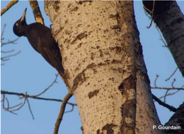
Pic noir